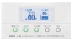
インターホンリモコンセット