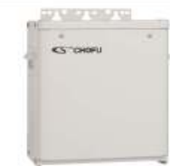
バックアップ電源ユニット